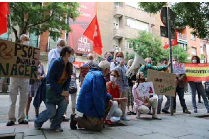
A la izquierda, concentración frente a la sede del PSOE con el lema 'Somos provida, no delincuentes'.

Tras la aprobación de la norma, promovimos la campaña 'Tribunal Constitucional: suspenda la ley de eutanasia' liderada por el doctor Ángel José Sastre, un prestigioso y veterano profesional experto en cuidados paliativos. Sastre pedía a los magistrados que paralizaran la norma que amenaza a los más vulnerables y obliga a los médicos a poner fin a su vida. Más de cincuenta y un mil ciudadanos respaldamos la petición. Además, en la entrega de firmas, convocamos a representantes de otras asociaciones que han luchado contra la eutanasia. Conseguimos, por otra parte, que el Partido Popular se decidiera a presentar el recurso contra esta norma ante el Tribunal Constitucional.