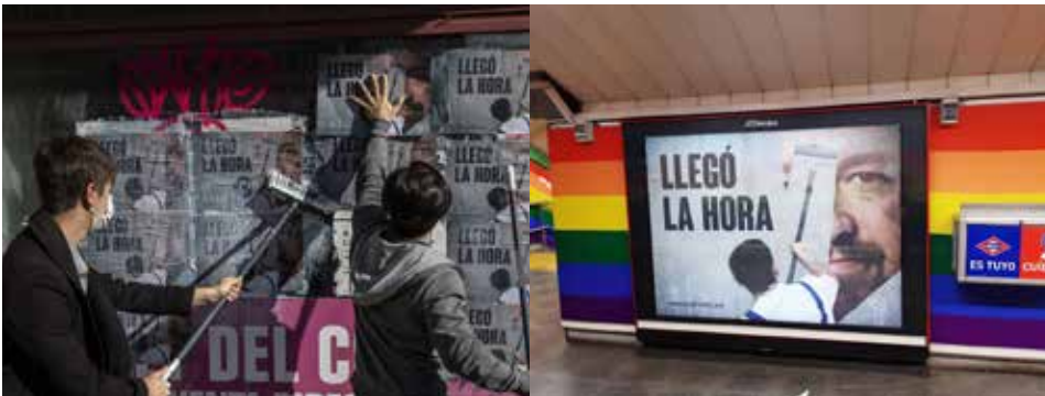
Jóvenes voluntarios de HazteOir.org pegan carteles con el lema 'Llegó la hora' en las proximidades de la sede de Podemos en Madrid.

Toda esta presión consiguió que Isabel Díaz Ayuso diera algunos pasos en defensa de la familia o del derecho de los padres a educar a sus hijos según sus propios valores y libres del adoctrinamiento LGTBI. Y muestra que el camino de la confrontación, especialmente durante la campaña electoral, es el correcto para defender nuestros valores.