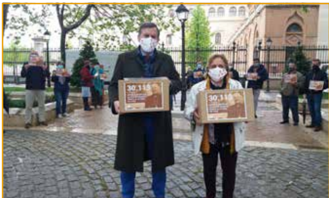
Voluntarios de HO acompañados por Ignacio Arsuaga, momentos antes de entregar firmas de apoyo al obispo de Alcalá de Henares.