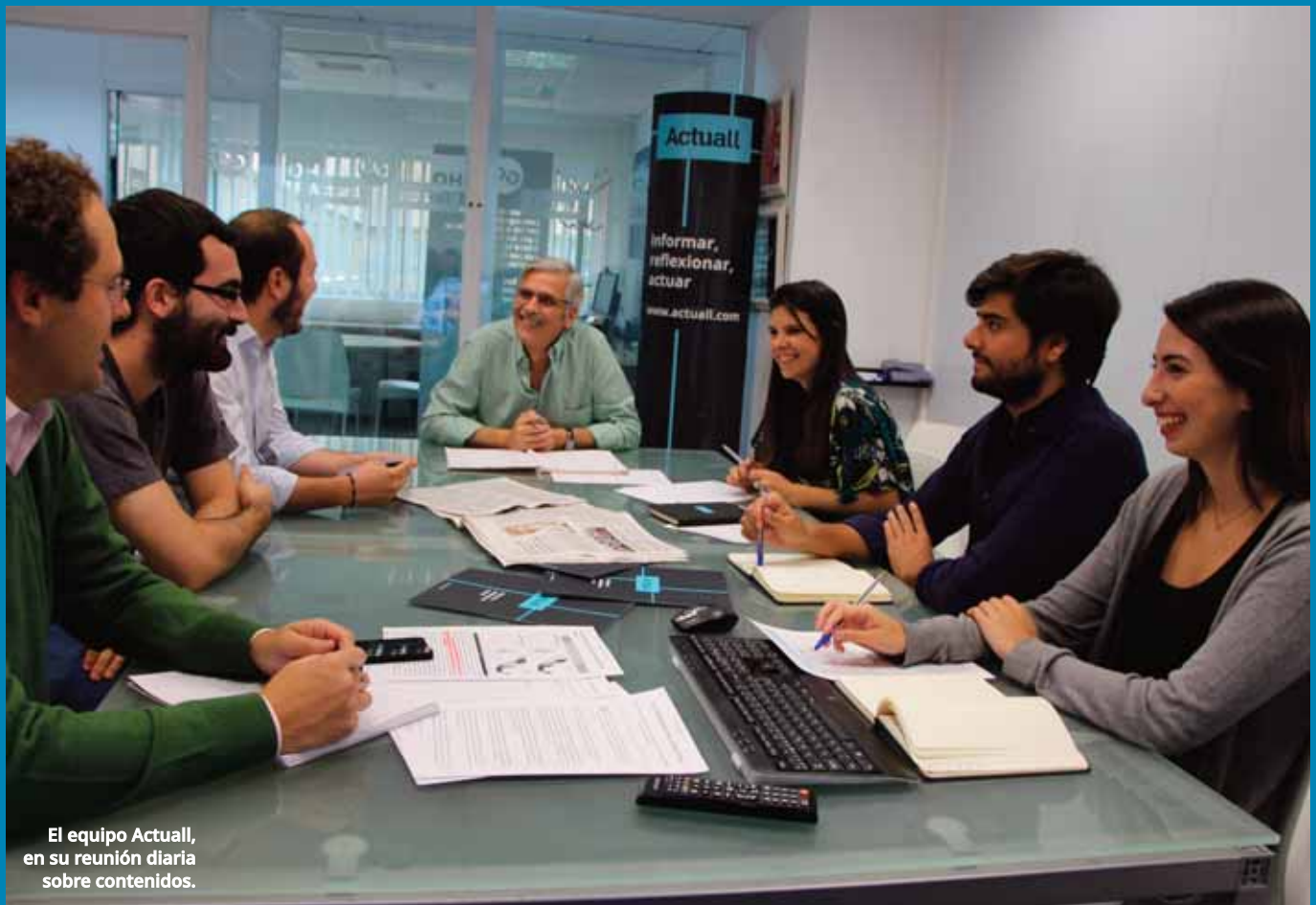
El equipo Actual, en su reunión diaria sobre contenidos.